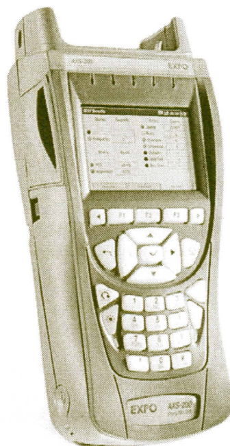
Рисунок 1 - Внешний вид системы измерительной AXS-200

Схема пломбирования от несанкционированного доступа и обозначение места для размещения наклеек приведены на рисунке 2.